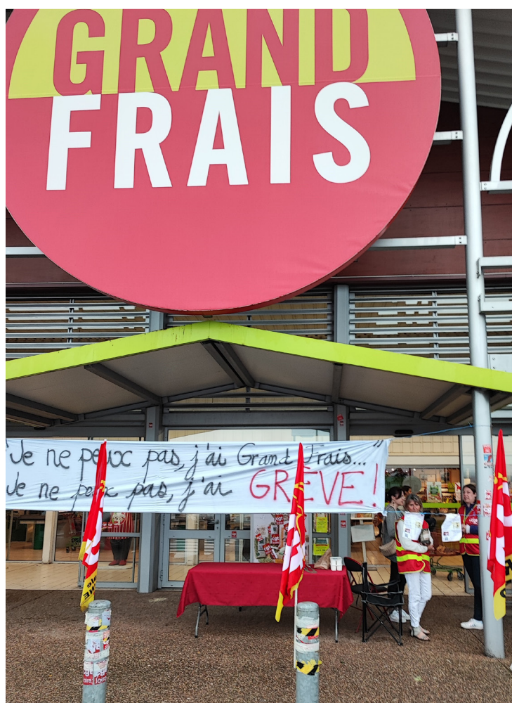
Lutte Grand Frais

leurs conditions de travail. Après un mois de grève qui s'est étendu à d'autres Grand Frais au niveau national, les salariées reprennent le travail la tête haute, dignes. La Société Prosol détenant Grand Frais , a pour la première fois, vacillé face à la détermination de ces hôtesses de caisse. ■